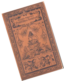
Die Erstausgabe: Praktisches Kochbuch für den bürgerlichen Haushalt . 1900, mit 333 Rezepten und 20 Anleitungen